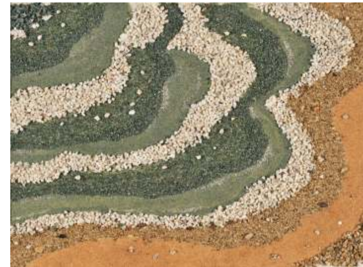
Izabelle Czagány, HU