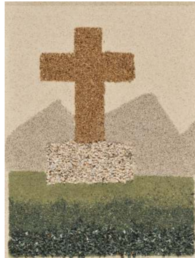
Zlatko Kuftić, HR