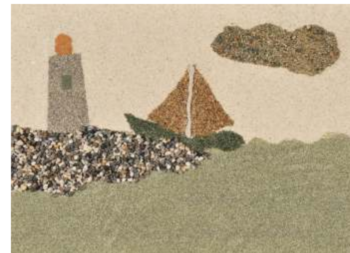
Angel Tamásné, HU