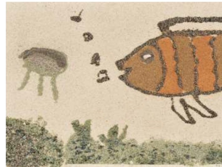
Elvis Vujič, SLO