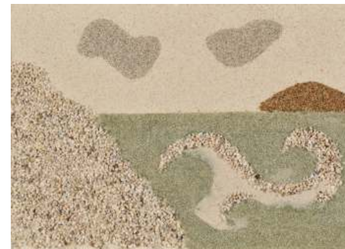
Danijela Stoković, HR