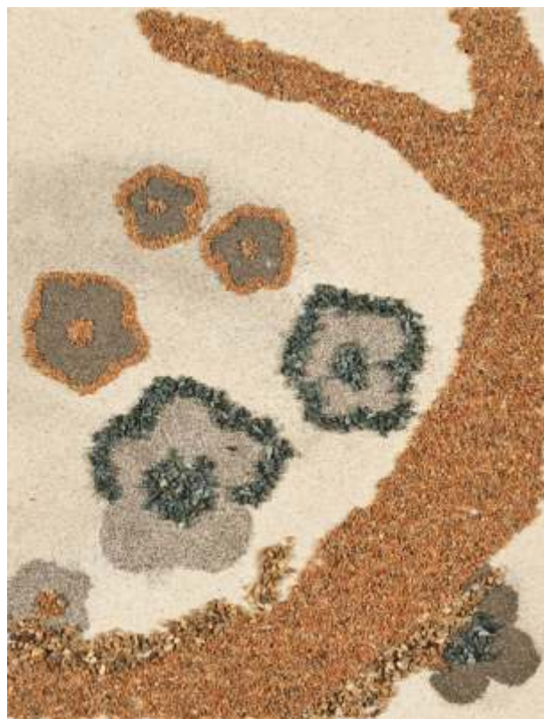
Fatime Nyikes, HU