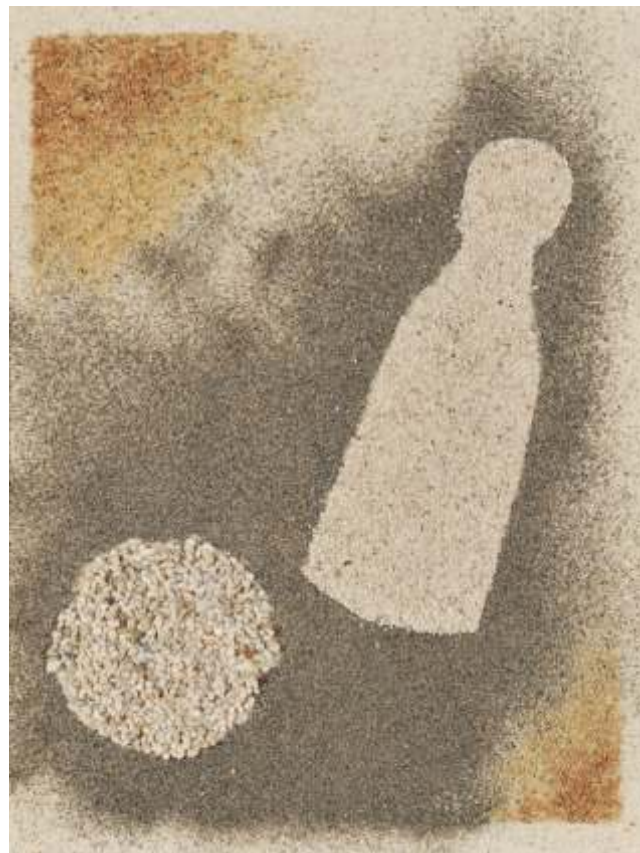
Tomaž Furlan, SLO