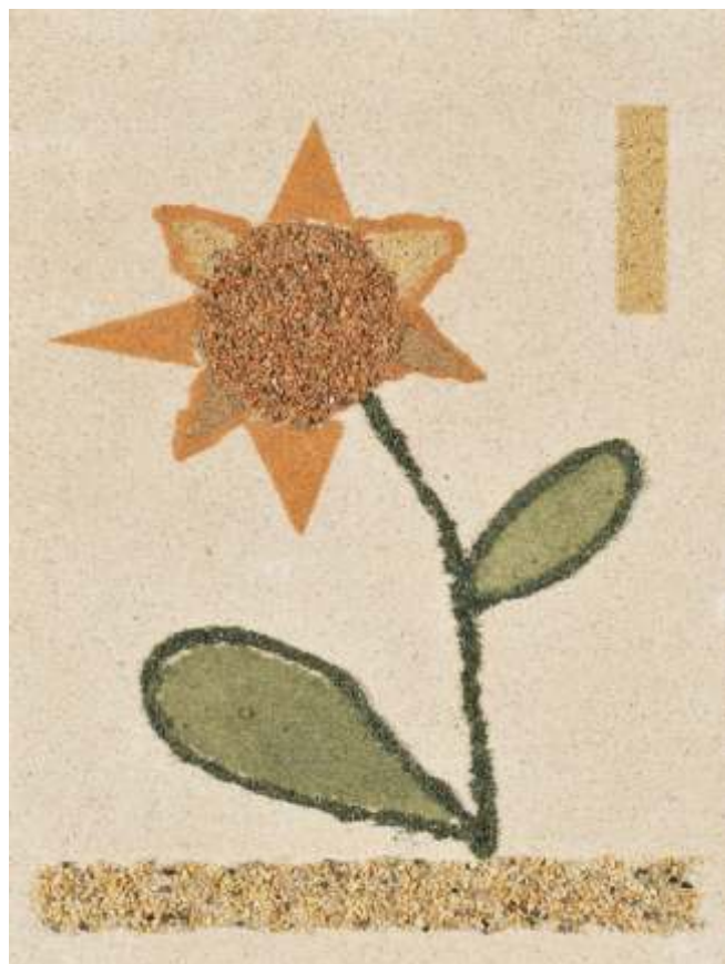
Tereza Zihel Škrbec, SLO

Zanimivo razmerje med vidno in drugače začuteno realnostjo je presenetljivo blizu tistemu, kar počenja slikarstvo v svoji klasični maniri. Transformacija realnega je podoba zanimive izkušnje vizualnega dejstva, ki smo je vajeni, vendar se v polju spremenjenih pozicij izkusvenost drugače idealizira. Miselno razširjeno in nadgrajeno ozadje ujetega prizora je splošna karakteristika likovne upodobitve, vendar ko nastopi drugačna senzibilnost, ko imamo likovnost pod drugačnimi pogoji, ko je vse predstavljeno v čutenje energetskih nabojev, ki jih naslikano sproži, se še bolj čudimo likovnim potencialom. Da so povsem ali skoraj slepi ljudje sposobni ustvariti likovno delo je njihovo vodilo vsekakor tip, vendar z izkazano avtonomnostjo v izdelavi potrjujejo naš začetni diskurz. Podoba ima nad-vidno energijo, ki oddaja na vzporednih frekvencah. Kar drugače pomeni, da je mogoče slike ne samo videti, ampak jih tudi drugače čutiti. Enaindvajset avtorjev s podobami pred nami sledne dokazuje. Vsekakor izkazujemo njihovemu trudu in delu vse spoštovanje.